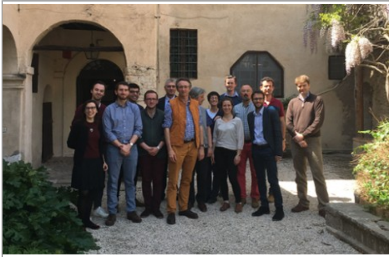
International Network in Philosophy of Religion, le réseau international qui fédère les jeunes philosophes