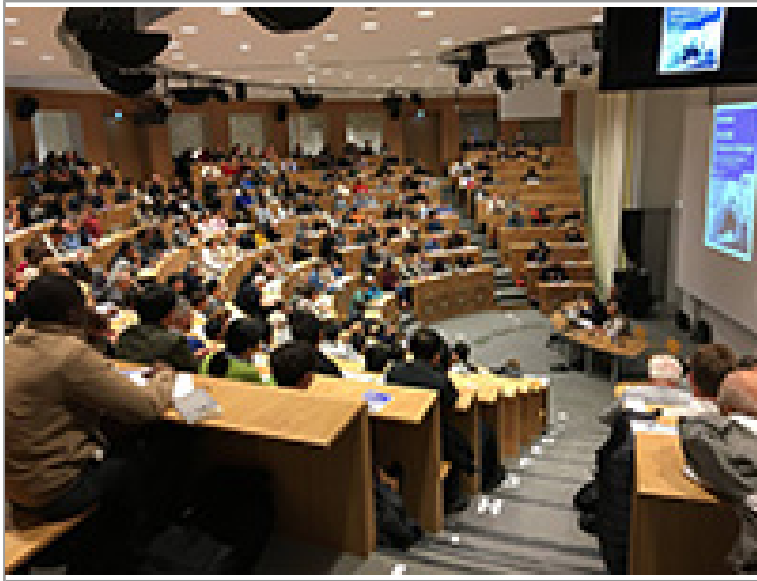
Rentrée 2019-2020 au Theologicum