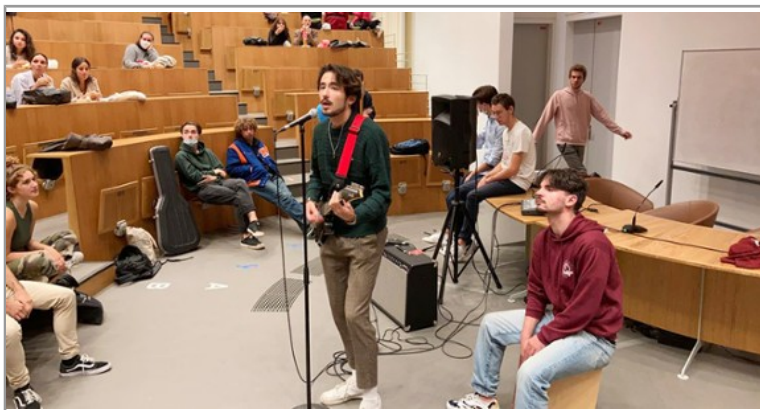
Les associations et initiatives étudiantes font leur rentrée