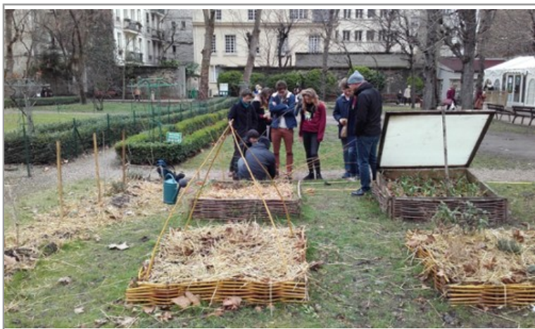
Potager médicinal et monastique