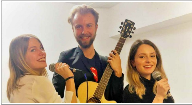
De concert avec Mus'ICP