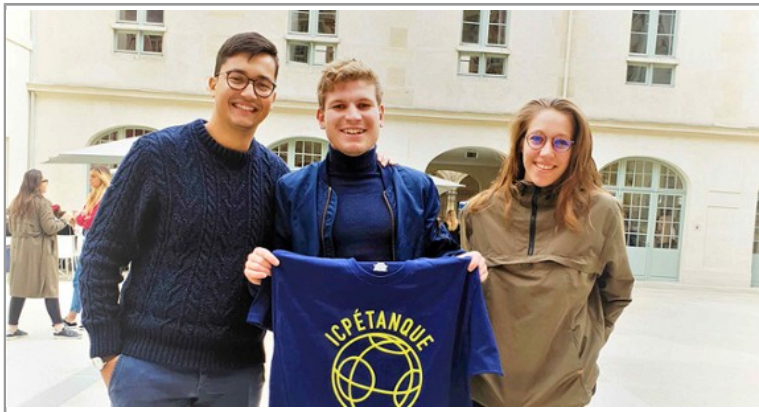
Un esprit sain dans un corps sain !