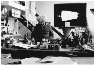
Centre Thomas Gleb