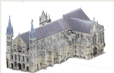
Modélisation 3D de la basilique Saint-Remi ©Ségolène Delamare