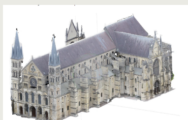
Modélisation 3D de la basilique Saint-Remi ©Ségolène Delamare