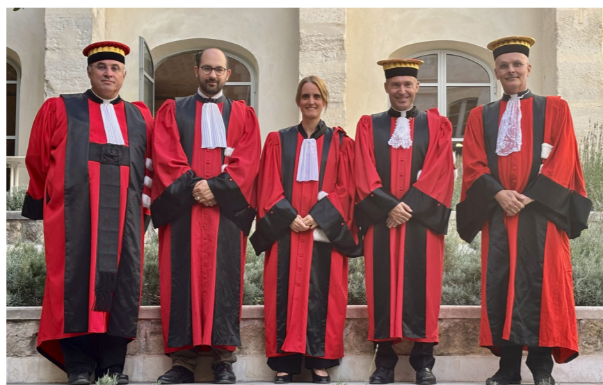
LES ENSEIGNANTS DE LA FACULTÉ DE DROIT CANONIQUE LORS DE LA RENTRÉE SOLENNELLE DE SEPTEMBRE 2025

Par la signature d'une convention avec la Faculté de Théologie catholique de l'Université de Strasbourg en 2024 : tout étudiant régulièrement inscrit et ayant validé ses examens à la Faculté de Droit canonique de l'ICP pourra être titulaire : > d'une Licence d'État en Droit canonique à l'issue de sa 1 re année en Licence canonique de Droit canonique, > d'un Master 1 d'État en Droit canonique à l'issue de la 2 e année de Licence canonique en Droit canonique > et d'un Master 2 d'État à l'issue de sa 3 e année en Licence canonique de Droit canonique.