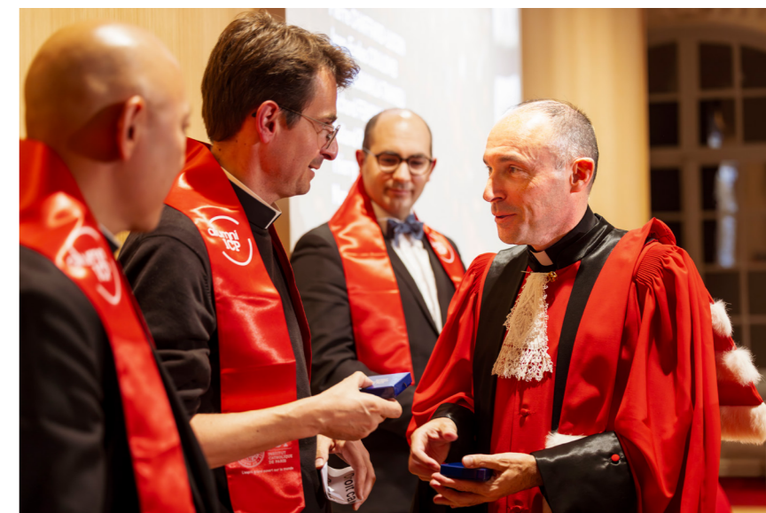
Remise de diplômes des doctorats, 2025

Les études durent 3 ans (six semestres), un aménagement de l'emploi du temps étant toujours possible.