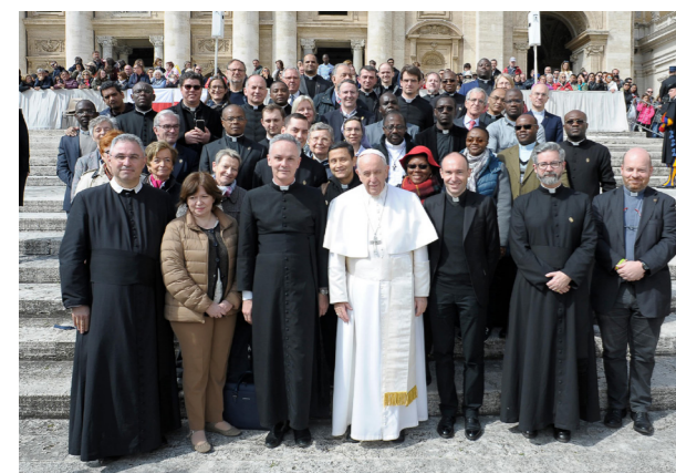
Voyage d'études à Rome consacré à la contribution des droits sacrés au lien social Avec le pape François, 2019