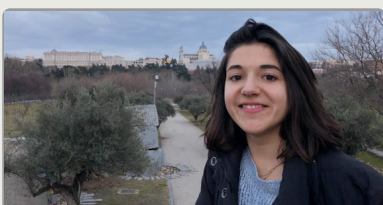
Assistante de langue à l'étranger : une expérience formatrice