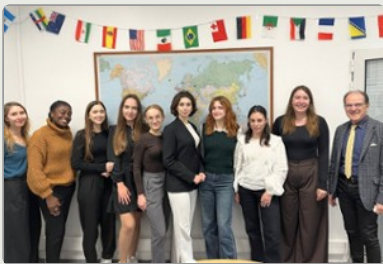
Erasmus+ : renforcer les liens avec l'Ukrainian Catholic University