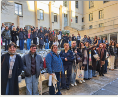
Un escape game pour des journées d'accueil originales à l'ICP