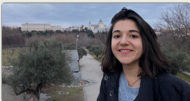
Assistante de langue à l'étranger : une expérience formatrice