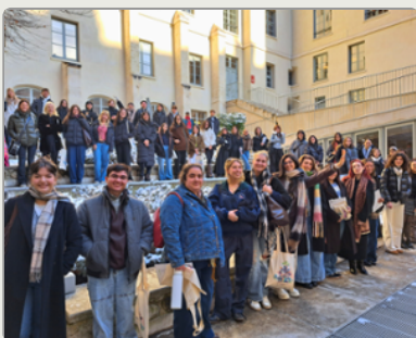
Un escape game pour des journées d'accueil originales à l'ICP