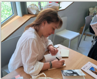
Concours de nouvelles 2026 : des voix de passage sous le regard de Laura Alcoba