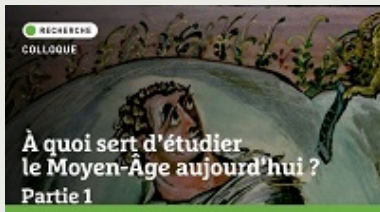
Colloque IEM | À quoi sert d'étudier le Moyen Âge aujourd'hui ?