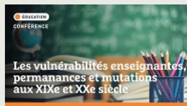
Conférence | Les vulnérabilités enseignantes, permanences et mutations aux XIXe et XXe siècle