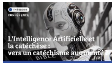
Webinaire | L'Intelligence Artificielle et la catéchèse : vers un catéchiste augmenté ?