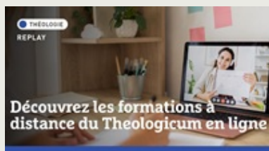
Replay | Découvrez les formations à distance du Theologicum en ligne

Retrouvez ici une sélection de rediffusions de nos webinaires et autres événements marquants.