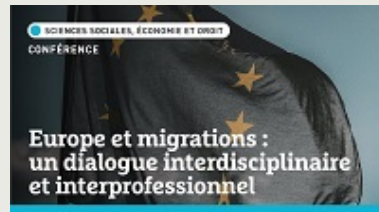
Conférence | Europe et migrations : un dialogue interdisciplinaire et interprofessionnel