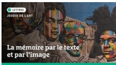
Jeudis de l'art | La mémoire par le texte et par l'image