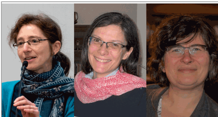
Nominations au Theologicum : portraits de théologiennes, directrices de département et d'institut de formation