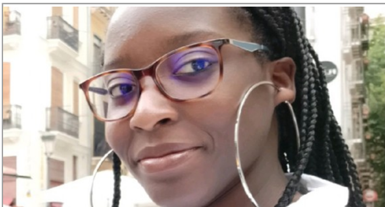
Diplômée de l'ELCOA, ses connaissances lui ouvrent les portes du monde de l'art