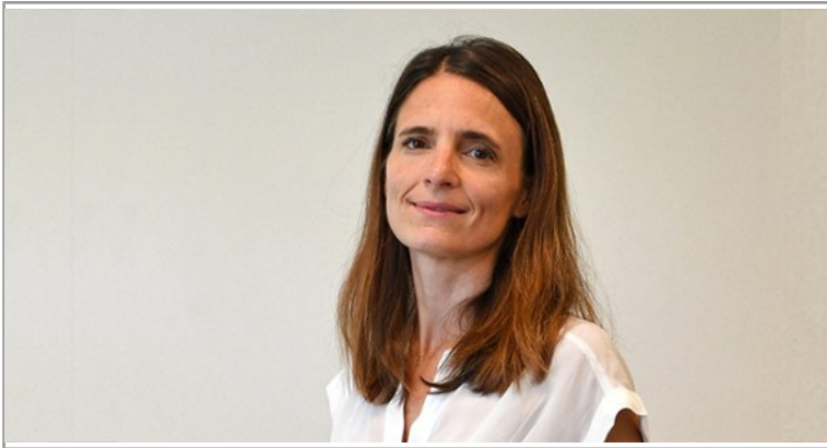
Questionner ses pratiques professionnelles pour mieux accompagner les équipes( https://www.icp.fr/a-propos-de-licp/portraits/questionner-ses-pratiques-professionnelles-pour-mieux-accompagner-les-equipes )