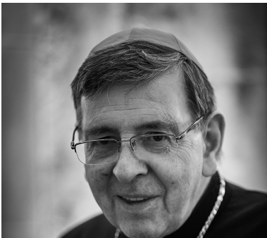
Cardinal Kurt Koch , Préfet du Dicastère pour l'unité des chrétiens

Séance inaugurale solennelle, en présence de :