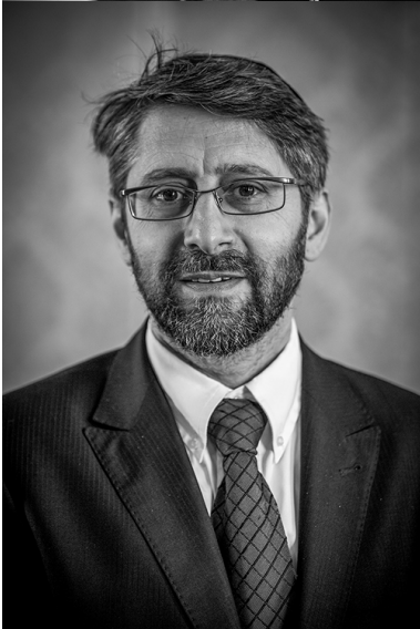
Haïm Korsia , Grand Rabbine de France