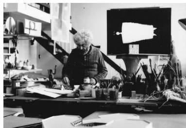
Centre Thomas Gleb