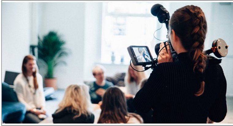
Réunion d'information Prépa CELSA et Prépa Journalisme