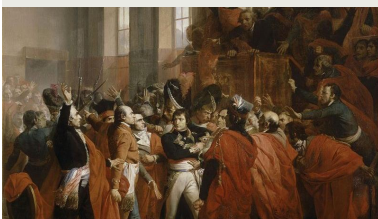
Le général Bonaparte au Conseil des Cinq Cents à Saint-Cloud par François Bouchot