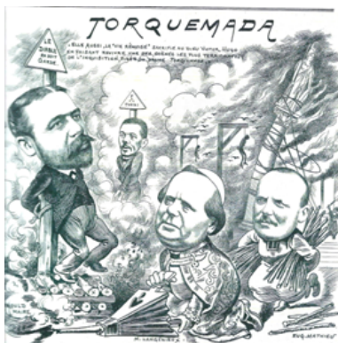
Michel Royer - Caricature de 1902 - Bibliothèque Carnegie

Une caricature de 1902 montrant le maire, l'anticlérical Charles Arnould, sur un bûcher et entouré de potences où pendent des conseillers municipaux dont l'adjoint Adrien Pozzi auquel est attribuée une appartenance maçonnique. Le cardinal Langénieux, archevêque de Reims, nouveau Torquemada, attise le feu (Source : Bibliothèque Carnegie).