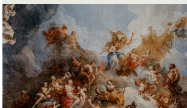
L'Apothéose d'Hercule par François Lemoyne, décors peints du Salon d'Hercule, Château de Versailles