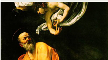
Saint Mathieu et l'Ange de Caravage - Bnf