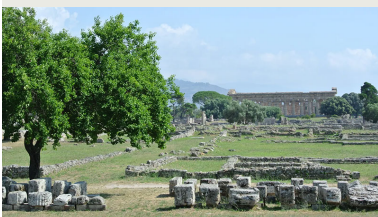
Temple de Neptune, Paestum, Campanie, Italie

Livret du colloque en français et en anglais