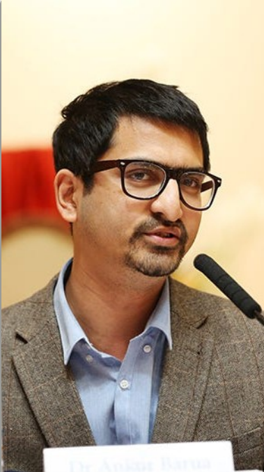
Ankur Barua Maître de conférences en études hindoues à la Faculté de théologie de l'Université de Cambridge