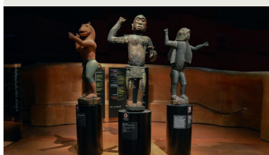
Art africain, Musée du Quai Branly