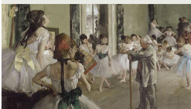
La Classe de danse par Edgar Degas, conservée au Musée d'Orsay