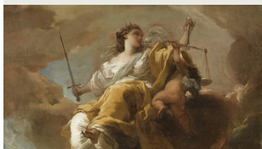
Allégorie de la Justice, par Gandolfi