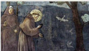
Giotto di Bondone, Le Prêche aux oiseaux, 1296-1299