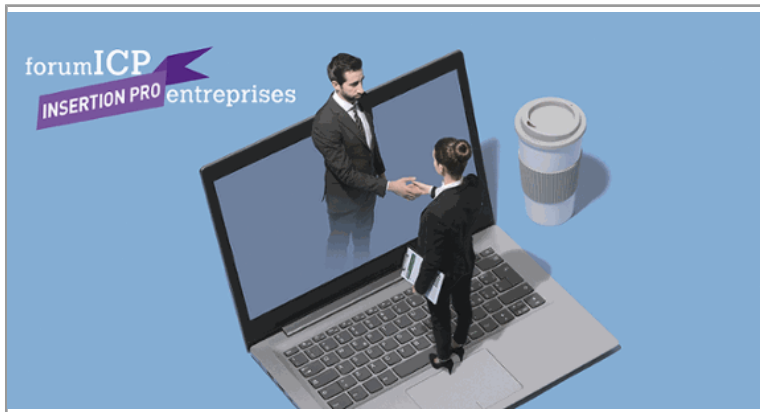
Un e-Forum du Recrutement de l'ICP pour faciliter la recherche de stage