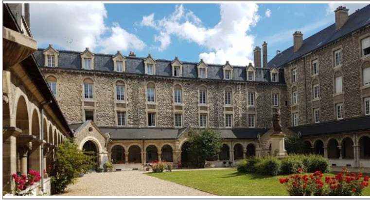
L'ICP ouvre son premier campus en dehors de Paris à Reims pour la rentrée 2021