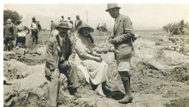
Max Mallowan, Agatha Christie et l'archéologue Leonard Woolley à Ur in 1931.