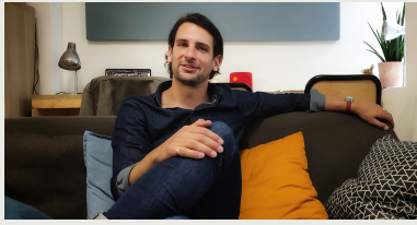
Arthur : Innover et Philosophier