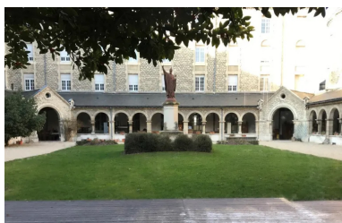
Cloître de la Maison Saint-Sixte

La vocation initiale de ce site et son architecture typique, déployée autour d'un vaste cloître et d'une somptueuse chapelle, en font, de fait, un proche parent du Couvent devenu Séminaire des Carmes, cœur historique de notre campus parisien.