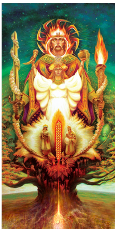
L'Arbre de vie , tableau de Viktor Krijanivskiy, peintre apprécié des adeptes des théories de

L'Ukraine impériale voit également émerger la question des origines. Des figures comme Mykhaïlo Hrushevsky (1866-1934) puisèrent dans la mythologie pour nourrir une identité culturelle vivante. Ensuite, durant l'entre-deux-guerres, l'Ukraine voit fleurir diverses tentatives de synthèses entre nationalisme ukrainien, néo-paganisme slave et références aux origines aryennes, comme celle de Volodymyr Shaïan (1908-1974), fondateur de l'Ordre des Chevaliers solaires. Selon lui, l'Ukraine incarnerait l'un des derniers bastions d'une civilisation aryenne authentique, héritière d'une sagesse védique – l'hindouisme étant considéré ici comme la dernière survivance de la tradition indo-européenne – opposée à la décadence occidentale et aux influences chrétiennes.