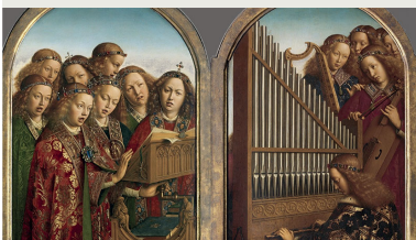
Jan van Eyck- Cathédrale Saint-Bavon

Comme chaque année, l'Institut Supérieur de Liturgie (ISL) de l'ICP a proposé deux sessions de formation, intégrées aux cursus et ouvertes aux auditeurs libres.