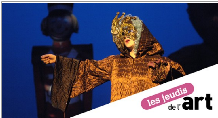
Cycle de conférences | L'art et la scène