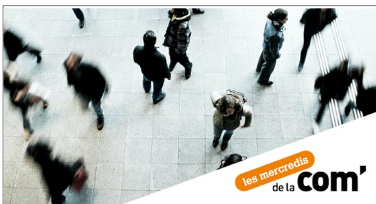
Cycle de conférences | La communication publique