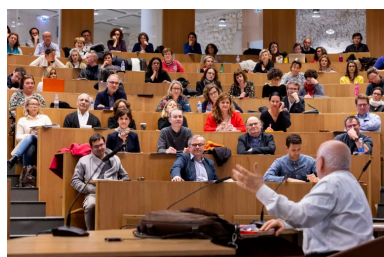
Cours du DU Médiateur à l'IFOMENE

L'IFOMENE (Institut de Formation à la médiation et à la négociation) a créé une formation de Médiateur et Consultant en communication de crise . Cette fonction permet d'intervenir dans la prévention et la résolution de conflits et crises dans tous types d'organisation, et contribue à la qualité du climat social et au développement du mieux-être au travail.