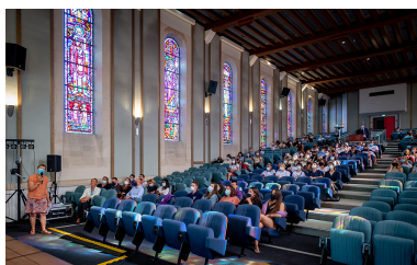
La salle Sorbon