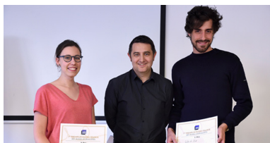
Lauréat 2015 du Tremplin Radio France