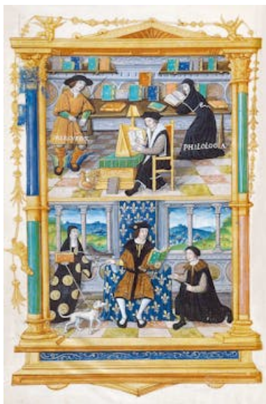
Maître anonyme, enluminure de dédicace, dans Guillaume Budé, L'Institution du prince, (Paris, BnF, Bibliothèque de l' Arsenal, vers 1518-1519).

Tardif, le mot « humanisme » s'appuie toutefois sur des expressions attestées chez les auteurs des XV e et XVI e siècles : studia humanitatis ou litterae humaniores , c'est-à-dire « études d'humanité » ou « lettres plus humaines », au sens actif de l'adjectif, à savoir « les lettres qui rendent plus humain » – ou encore, dans un esprit comparable, bonae litterae , les « bonnes lettres », non pas seulement au sens esthétique de « belles-lettres », mais aussi et plus encore au sens moral et éducatif de « lettres qui rendent bon, meilleur ».