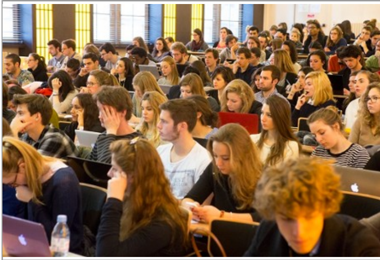
Rentrée des L2 et L3 Droit (DPSP)