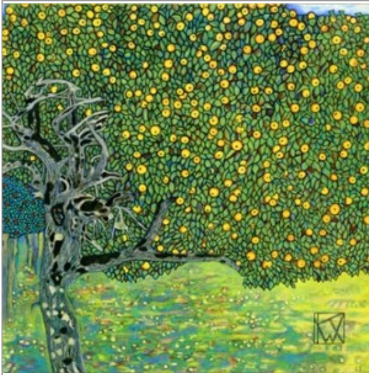
La compréhension entre amour et polémique, colloque de philosophie