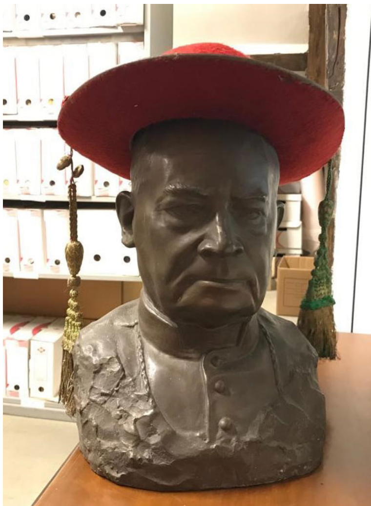
Des pépites bien conservées