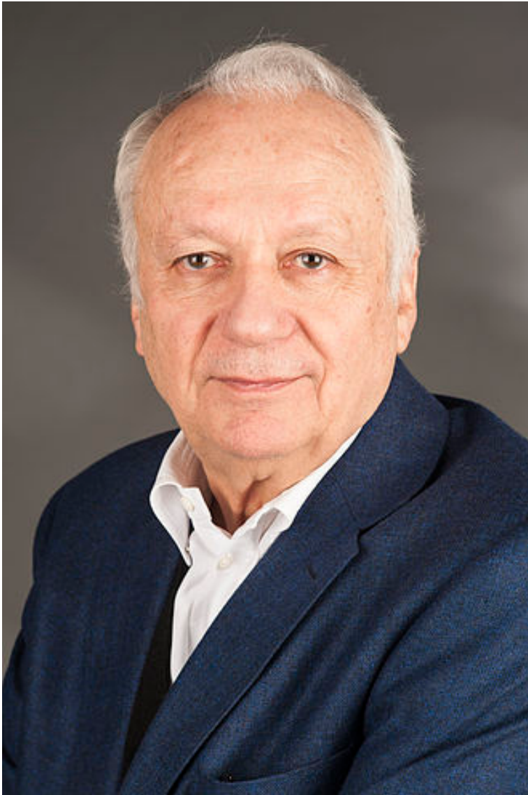
En prise directe avec un député européen

Pour cette nouvelle édition, Jean-Marie Cavada , député européen et ancien président de commission parlementaire, contrôle la conformité de la négociation à la réalité institutionnelle.