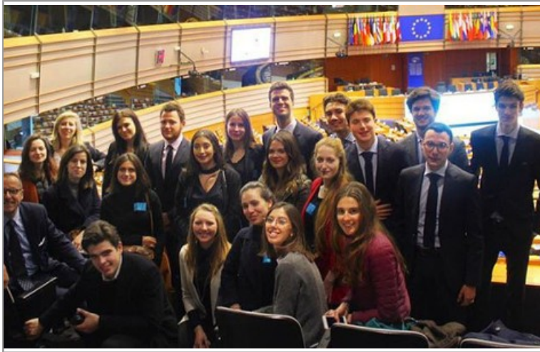
Des bancs de l'ICP aux sièges des institutions européennes